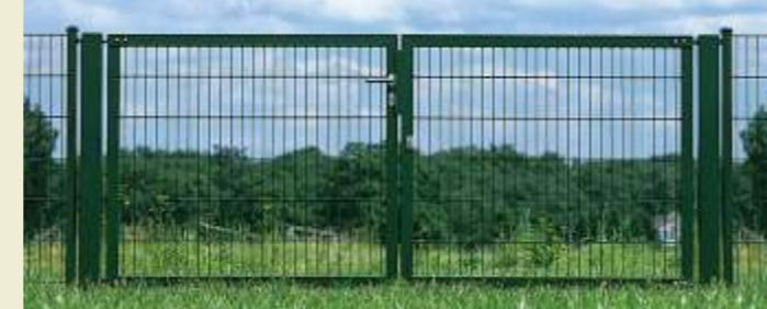
LEGI-Tor Vario-S 2-flügelig