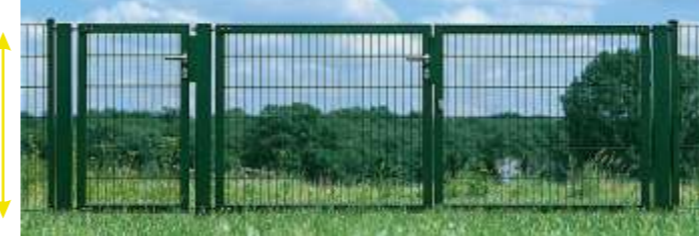
LEGI-Tor Vario-S 3-flügelig

2-flügeliges Drehtor von 2.000 bis 6.000 mm im 250er-Raster