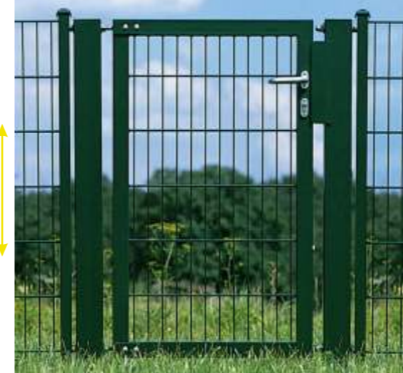
LEGI-Tor Vario-S 1-flügelig